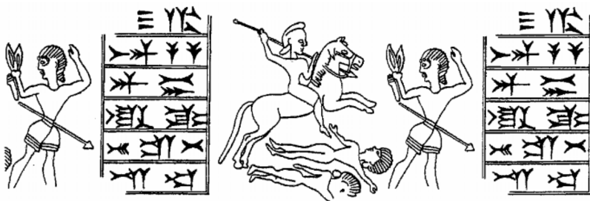
Disegno composto del sigillo di Kurash l'Anzanita (Garrison).

< http://www.elamit.net/corsi/#elamico >